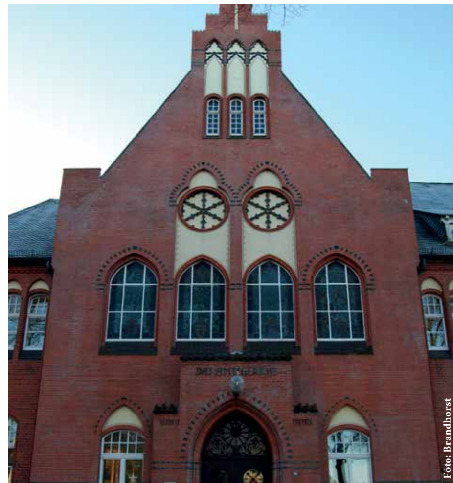
Wenn Straftäter zu einer Geldstrafe verurteilt werden, dann, weil Gerichte (hier das Amtsgericht Neumünster) wegen geringer Schwere eines Delikts von einer härteren Sanktion absehen. Trotzdem landen viele Betroffene im Knast.

Wenn Sie betroffen sind, rufen Sie bei einer der Einrichtungen an.