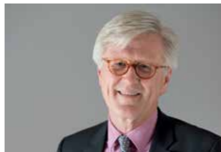
HEINRICH BEDFORD-STROHM, BIS NOVEMBER 2021 RATSVORSITZEN- DER DER EVANGELISCHEN KIRCHE IN DEUTSCHLAND (EKD)

Ich möchte das nicht. Leichtsinn zu vermeiden, ist richtig. Aber das Leben zu verpassen, weil wir jedes Risiko ausschließen wollen, wäre ein zu hoher Preis. Beide Perspektiven haben ihre Berechnigung, wenn es um das richtige Maß der Corona-Maßnahmen geht. Auch der Blick auf die seelische Inzidenz.