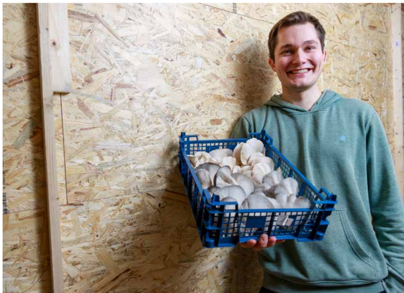
Vom Pilzzüchter geerntet: weiße Ulmenseitlinge oben in der Kiste, grüne Austernseitlinge unten.

Auf www.kieler-pilzwerk.de finden Sie weitere Informationen.