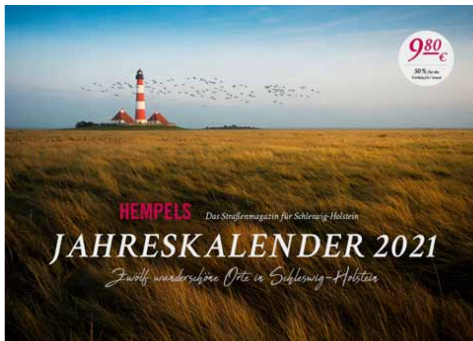
Das Cover unseres Jahreskalenders, der ab sofort im DIN-A3-Format bei den HEMPELS-Straßenverkaufenden erhältlich ist.