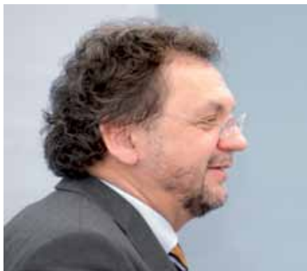
HERIBERT PRANTL, 66, PUBLIZIST UND JURIST. FRÜHERER RICHTER UND STAATSANWALT, SPÄTER MITGLIED CHEF- REDAKTION »SÜDDEUTSCHE ZEITUNG«

An diesem Ende muss nun ein neuer Anfang stehen: Dass man sich daran macht, die Gesetze der vergangenen Jahre zu korrigieren. Sie gehören so korrigiert, dass das Gesundheitswesen wieder zum Bestandteil einer gemeinwohlorientierten und bedarfsgerechten Daseinsvorsorge wird, die ebenso wenig wie die Wasserversorgung durchkommerzialisiert werden darf.