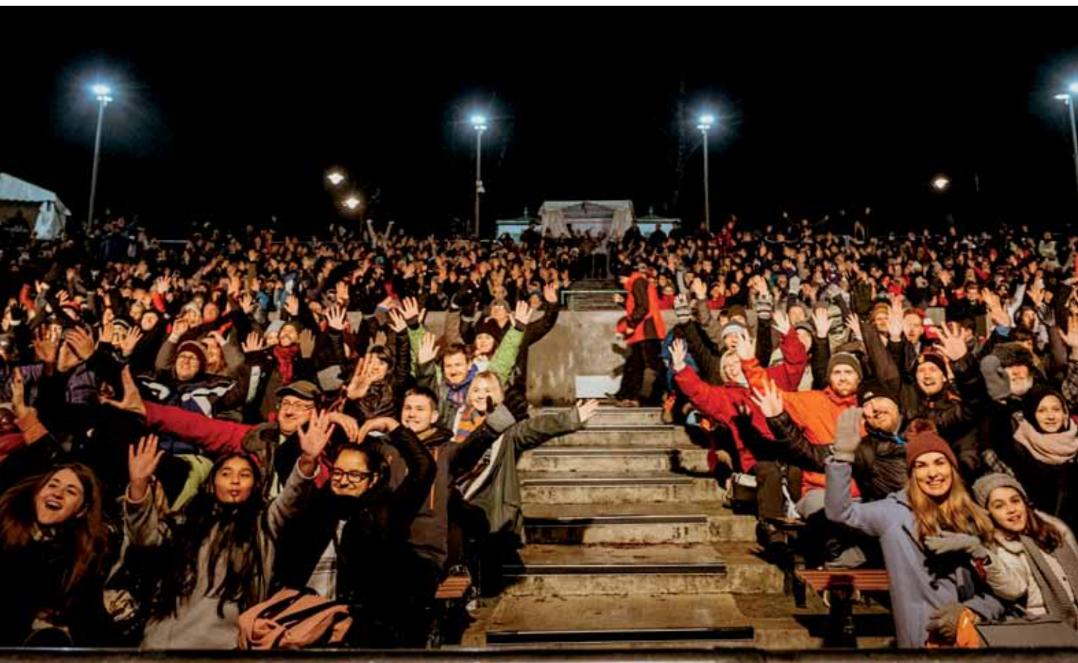
Das Publikum beim »sleep out« 2018 in Glasgow. Insgesamt bereits 10.000 Menschen haben in den ersten zwei Jahren des Bestehens an den Veranstaltungen teilgenommen. Unser Termin am 7. Dezember auf dem Wacken Open Air wird der erste in Deutschland sein.