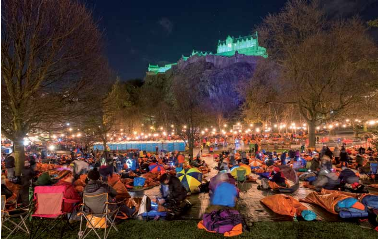
Vor zwei Jahren hat die schottische Initiative erstmals zu einem »sleep out« in Edinburgh eingeladen. Rund zweitausend Menschen nahmen bereits damals daran teil.

Übernachtungsveranstaltung Spenden sammeln.