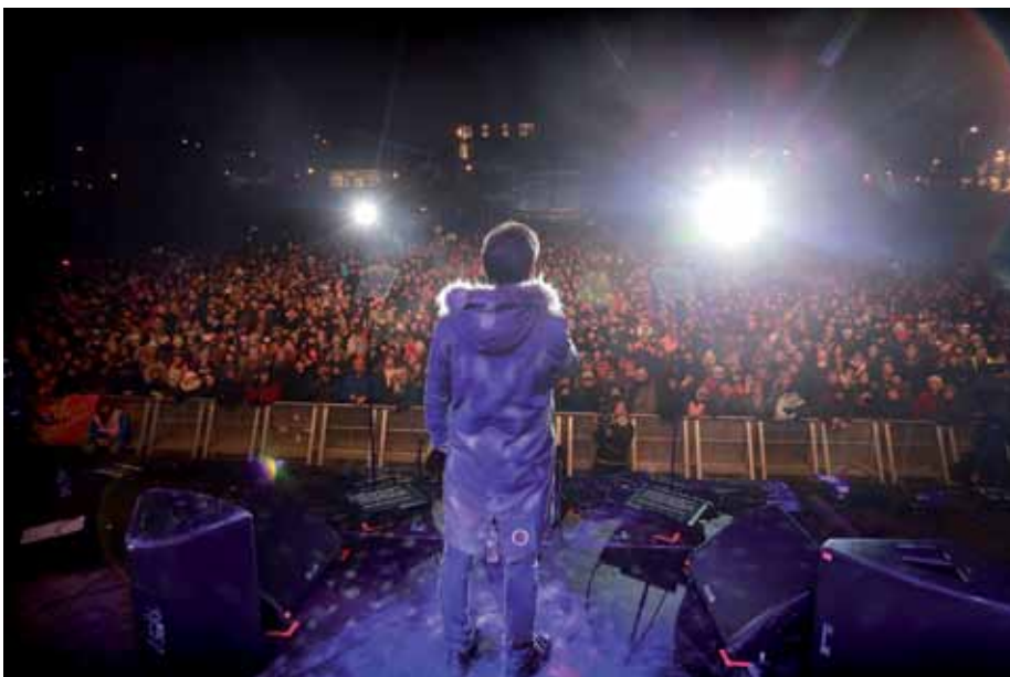
Musik und Kultur als fester Bestandteil: Impression vom ersten »sleep out« 2017 in Edinburgh.

Aber der Reihe nach: Seit zwei Jahren organisiert die Initiative »World's Big Sleep Out« (WBSO) in Schottland jeden Winter ein Draußenschlafen, um auf die Not obdachloser und wohnungsloser Menschen aufmerksam zu machen. Die bisher 10.000 Teilnehmer an mehreren Orten haben dabei Spenden gesammelt, mit denen beispielsweise Housing-first-Unterkünfte für Obdachlose gefördert werden. Fantastische zehn Millionen Dollar sind so bereits zusammengekommen. In diesem Jahr findet diese Initiative weltweit bereits an über 50 Orten zeitgleich unter freiem Himmel statt, Wacken wird die einzige Veranstaltung in Deutschland sein. Auch wir wollen bei unserer