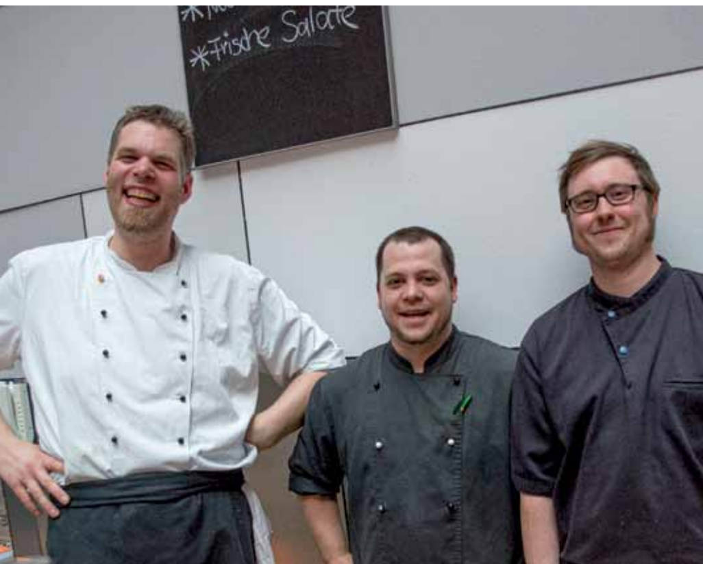
Sie kümmerten sich darum, dass für alle Gäste genügend Speisen da waren: Küchenmitarbeiter der Landtagskantine.