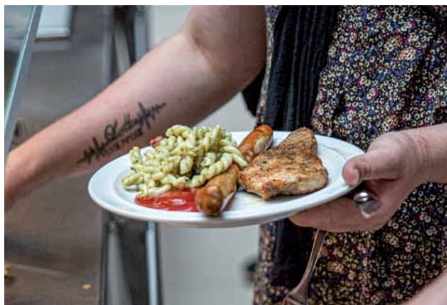
Zu essen gab es genug.