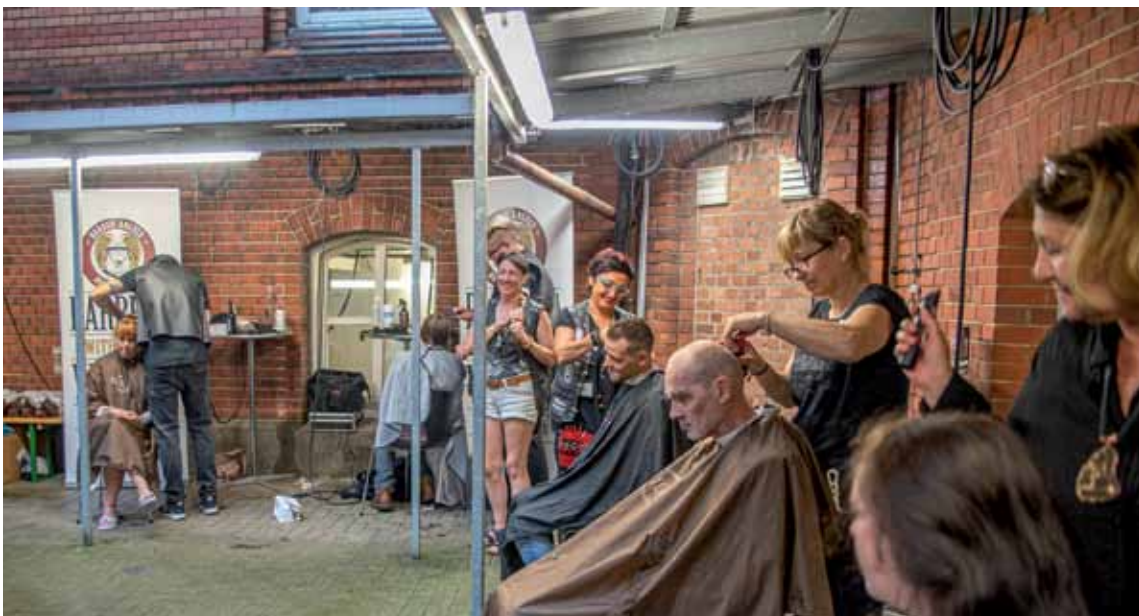
Barber Angels bei der Arbeit; Insgesamt 100 Frauen und Männer ließen sich kostenlos frisieren.