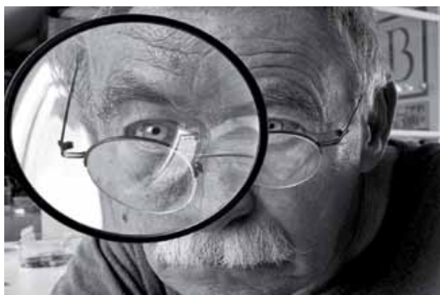
Fotograf Bernd Bünsche im Selbstporträt.