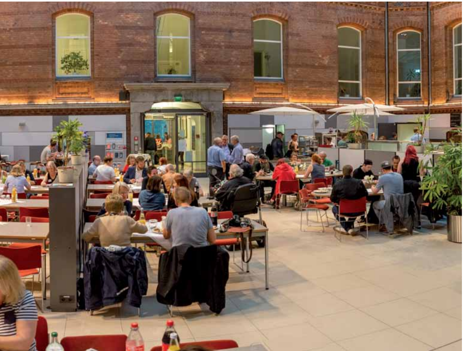
130 Gästen kamen zum Landeshaus. Wenn es draußen gewitterte und goss, wurde in der Kantine gegessen und miteinander gesprochen.