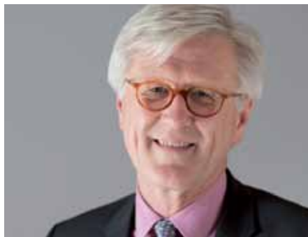
HEINRICH BEDFORD-STROHM, RATSVORSITZENDER DER EVANGELISCHEN KIRCHE IN DEUTSCHLAND (EKD)

Sich über moralische Verpflichtungen Rechenschaft abzulegen und sich immer wieder kritisch selbst zu prüfen, das ist eine zivilisatorische Errungenschaft. Schon die Grundorientierungen in den ältesten Rechtstraditionen des Alten Testaments schärfen die besondere Verpflichtung gegenüber den Schwachen ein.