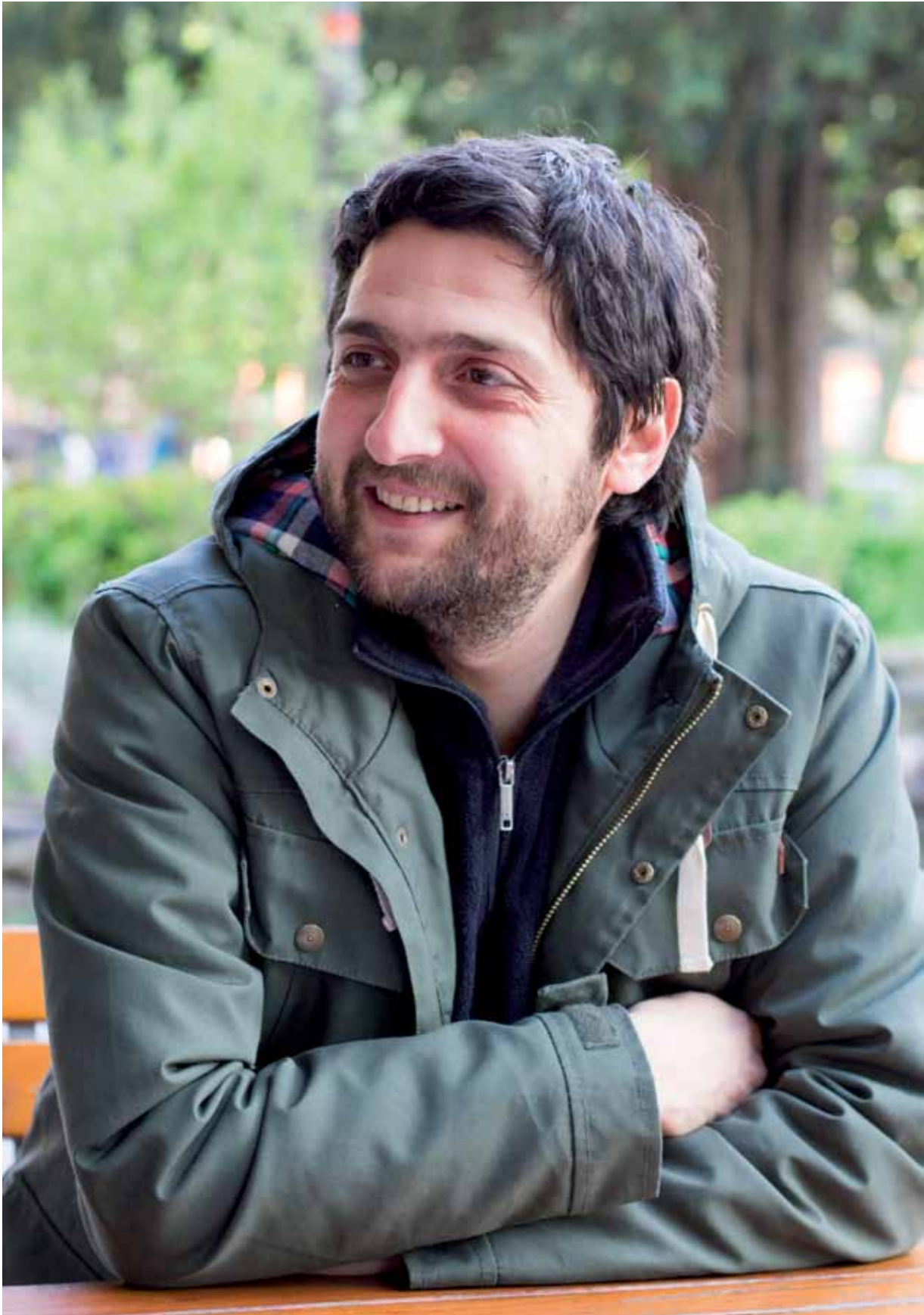
Der Dortmunder Soziologe Aladin El-Mafaalani.