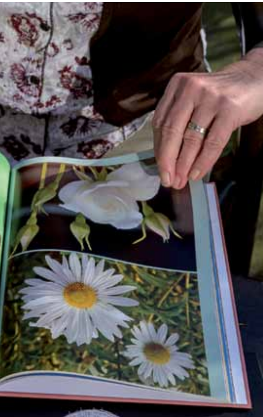
der Natur hat Behnken fotografisch festgehalten.

mehr geschafft – sie ist auch zu einer Stimme derer geworden, die zu häufig keine Stimme haben. »Die Politik muss für Obdachlose menschenwürdige Unterkünfte schaffen«, sagt Behnken, »man darf fremde Menschen nicht in einfachen Mehrbettunterkünften zusammenpacken, denn dann knallt's!« Die Gesellschaft, so ihre zentrale Forderung, muss mit Obdachlosen menschenwürdig umgehen.