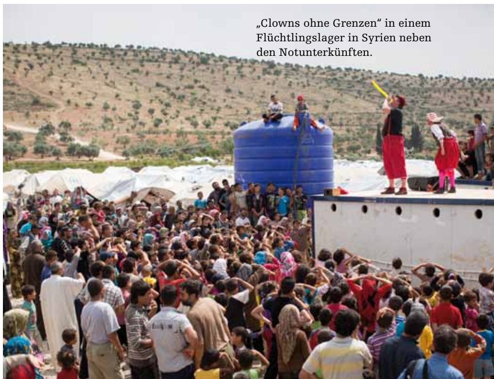
„Clowns ohne Grenzen“ in einem Flüchtlingslager in Syrien neben den Notunterkünften.