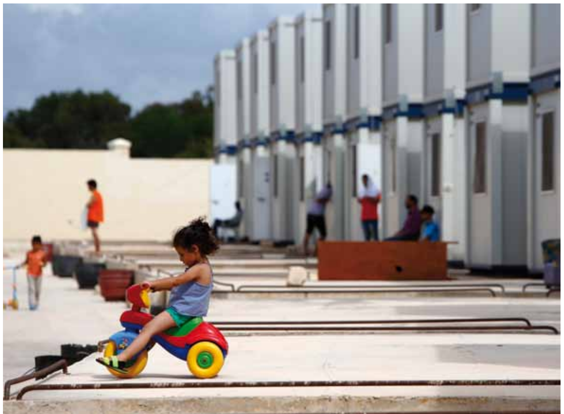
Oben: Ein auf einem Dreirad spielendes Flüchtlingskind im September 2014 vor einer Containerunterkunft für Migranten in der Nähe der maltesischen Hauptstadt Valletta.