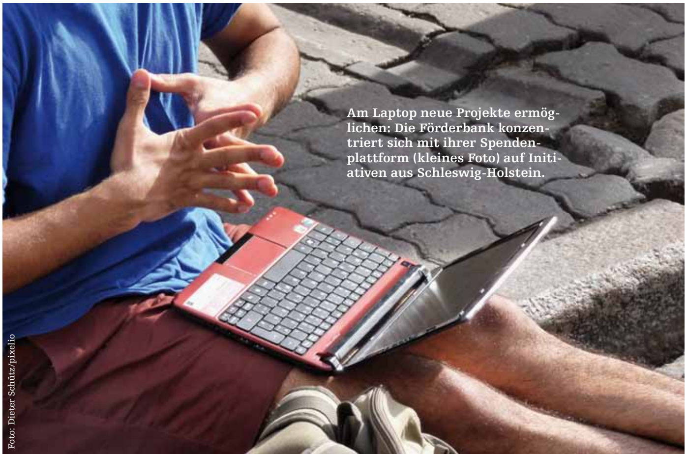
Am Laptop neue Projekte ermöglichen: Die Förderbank konzentriert sich mit ihrer Spendenplattform (kleines Foto) auf Initiativen aus Schleswig-Holstein.