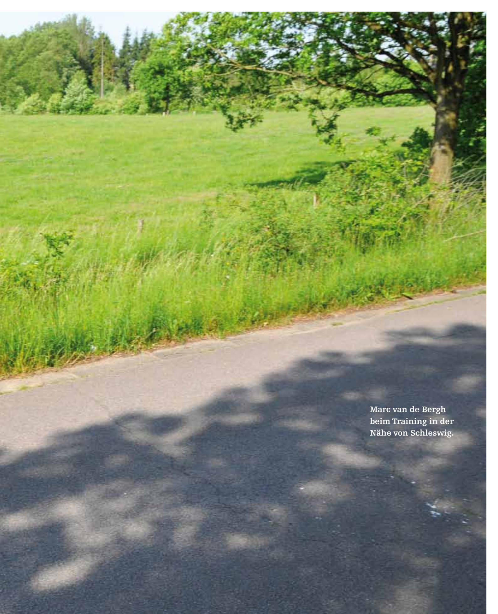
Marc van de Bergh beim Training in der Nähe von Schleswig.