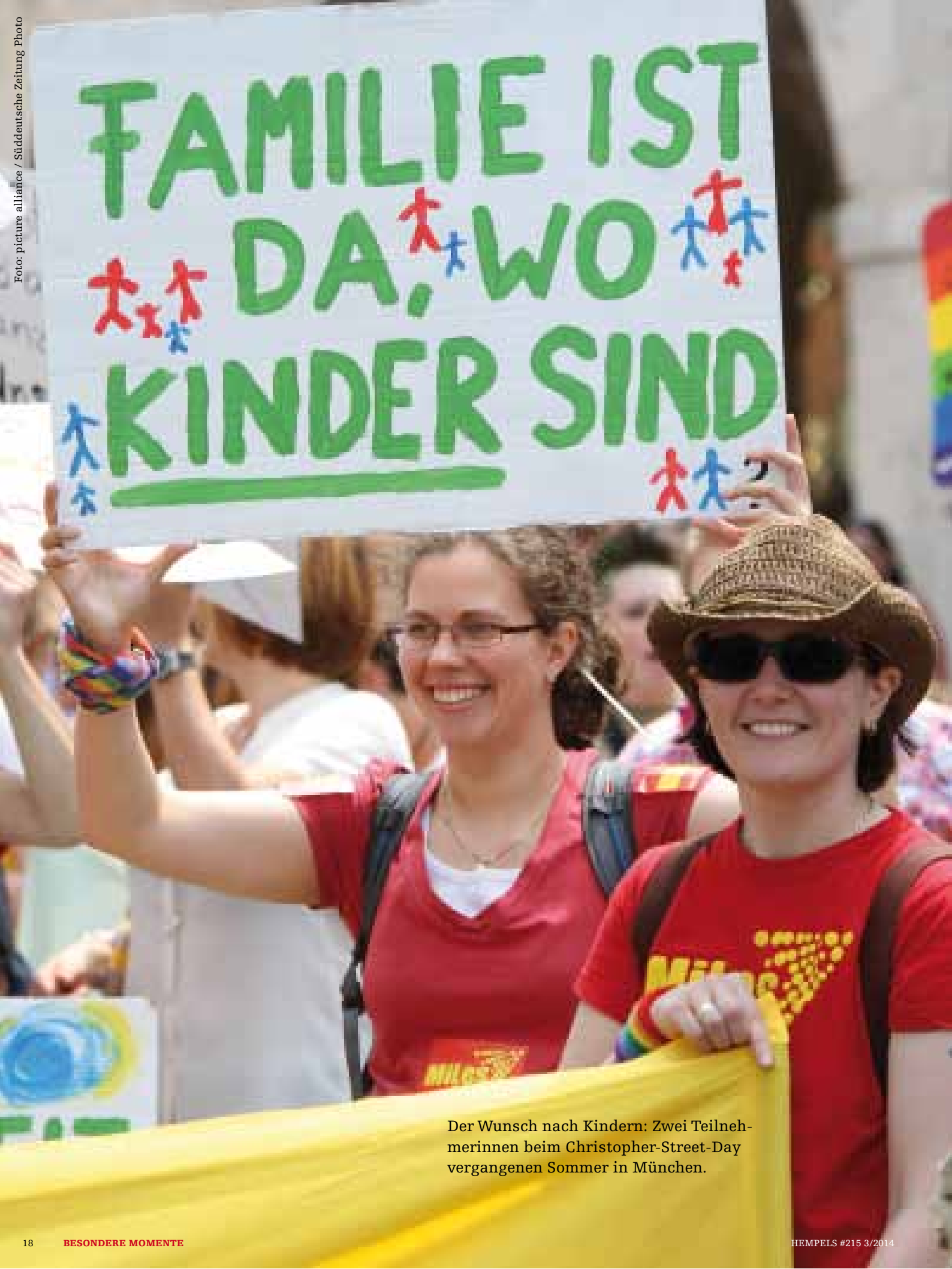
Der Wunsch nach Kindern: Zwei Teilnehmerinnen beim Christopher-Street-Day vergangenen Sommer in München.