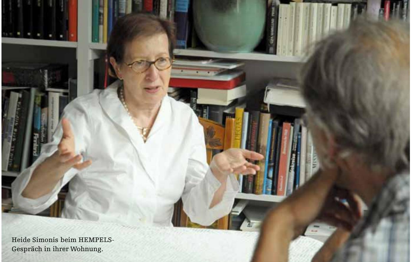
Heide Simonis beim HEMPELS-Gespräch in ihrer Wohnung.