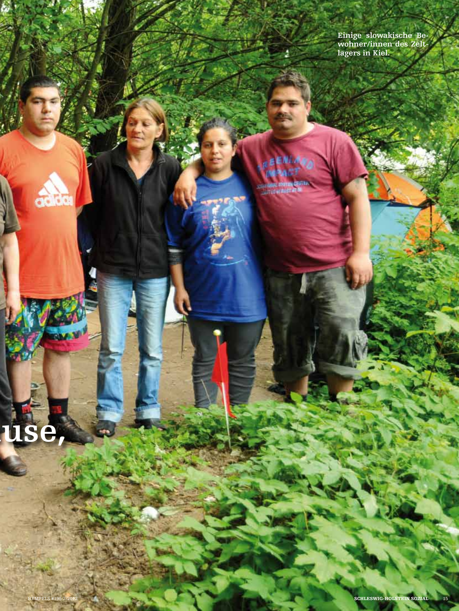
Einige slowakische Bewohner/innen des Zeltlagers in Kiel.