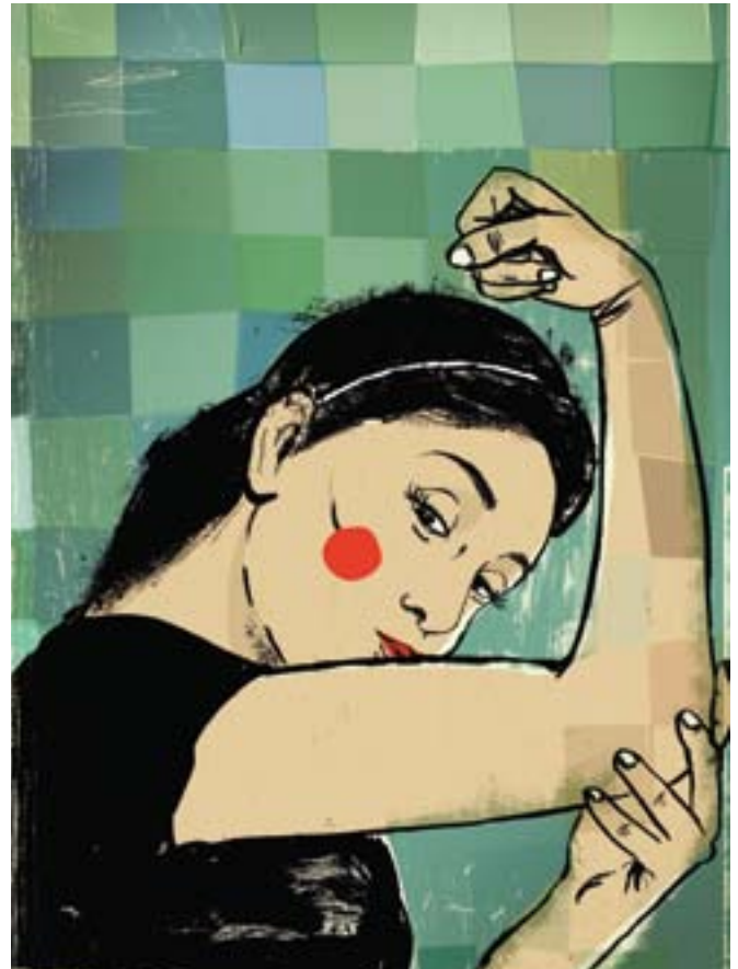
Illustration: Lehel Kovács/2agenten