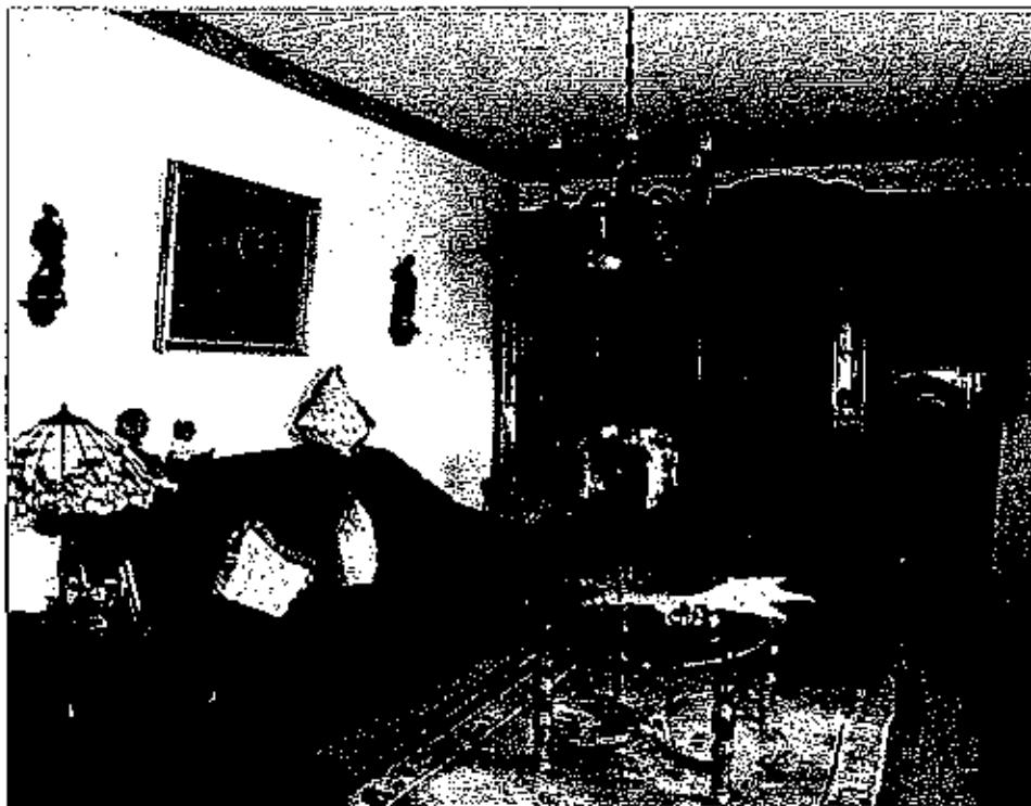
Die 78-jährige Lilo Willer (nicht auf dem Foto) lebt seit 40 Jahren in ihrer Wohnung.