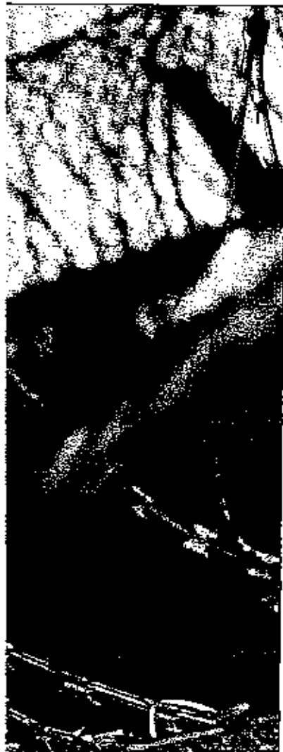
Foto: Ehrenamtliche Straffälligenhilfe hilft vor allem hinter Gefängnismauern – hier der Knast in Kiel. Die jetzt 25 Jahre alt werdende Stiftung Straffälligenhilfe unterstützt bei der Wiedereingliederung nach Haftentlassung.