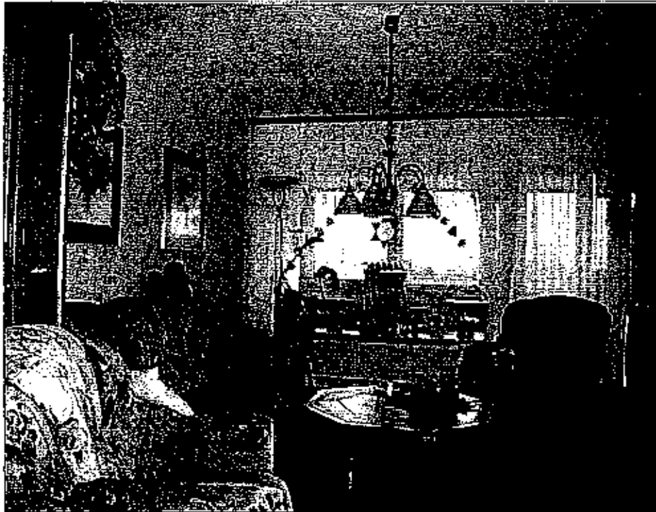
Das Wohnzimmer von Helga Lorenzen (69), die selbst nicht fotografiert werden wollte.